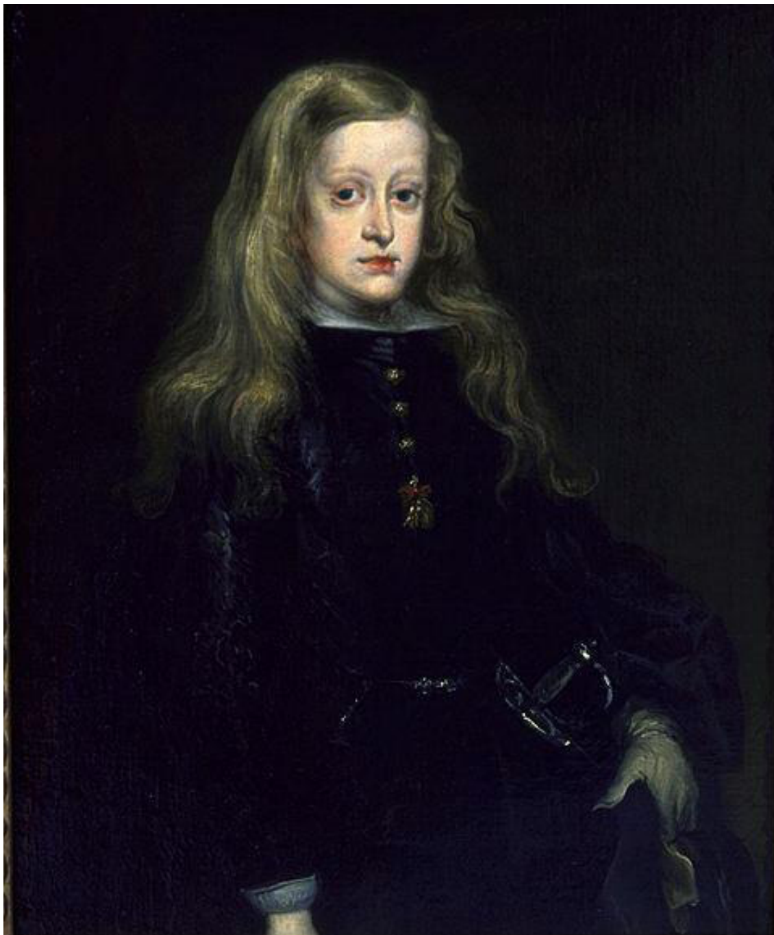
(Retrato de un joven Carlos II)