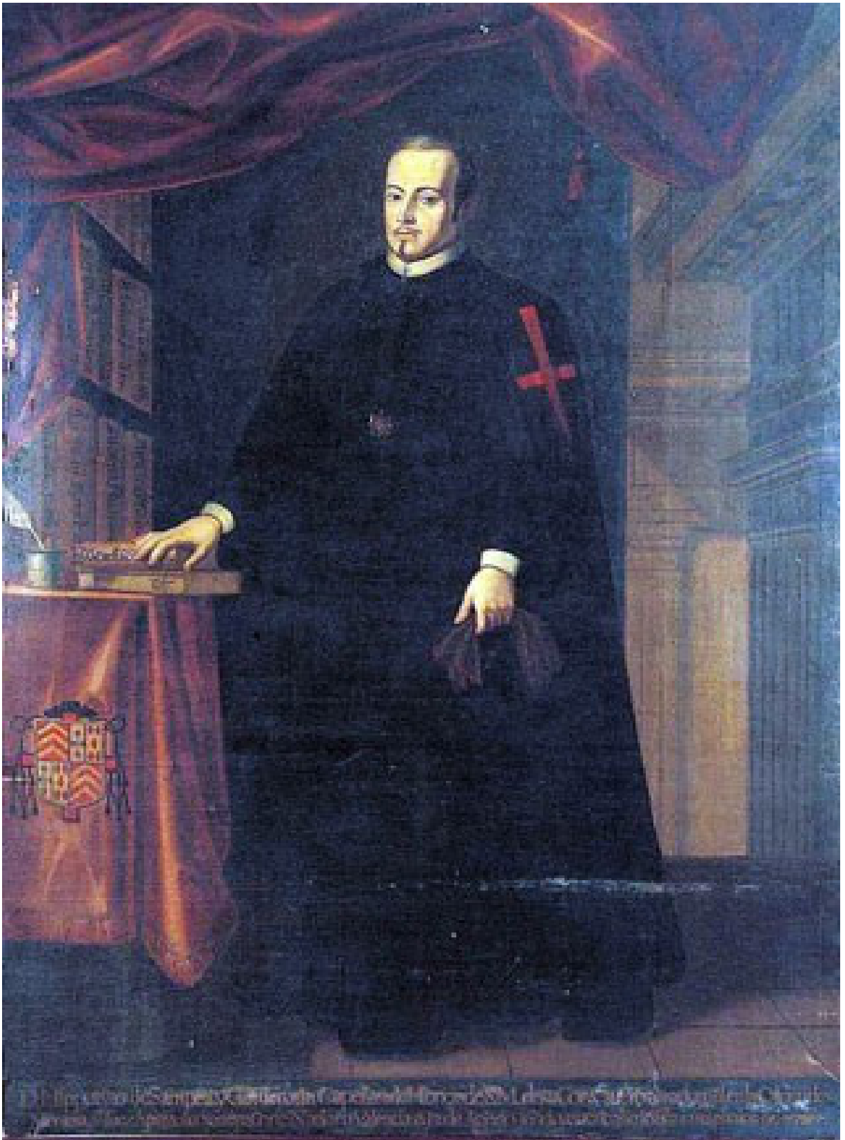
(Retrato del erudito Hipólito de Samper y Gordejuela)