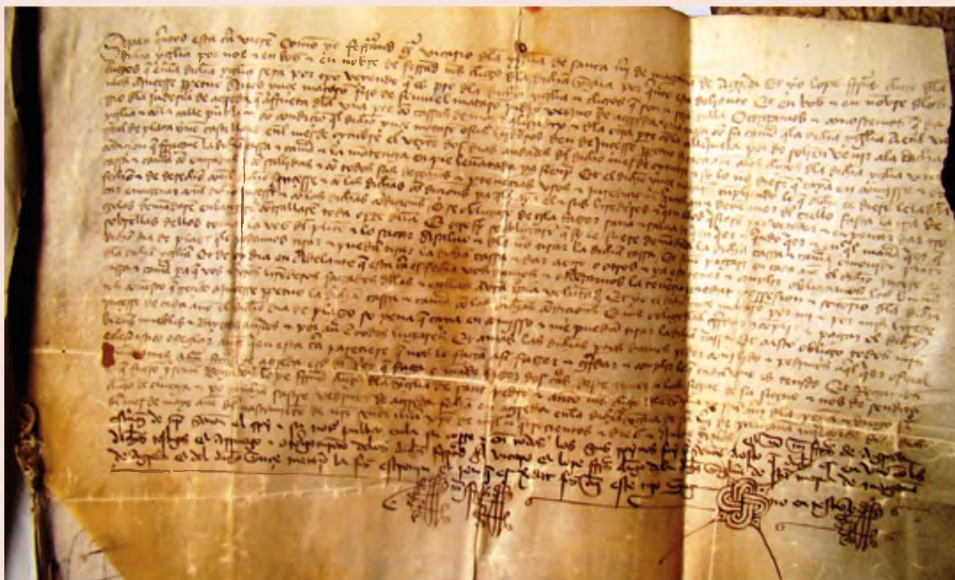
Contrato de arrendamiento de una casa en la Judería de Ágreda

Este documento es una aportación fundamental para aclarar totalmente la cuestión: se trata de una carta de censo perpetuo en pergamino