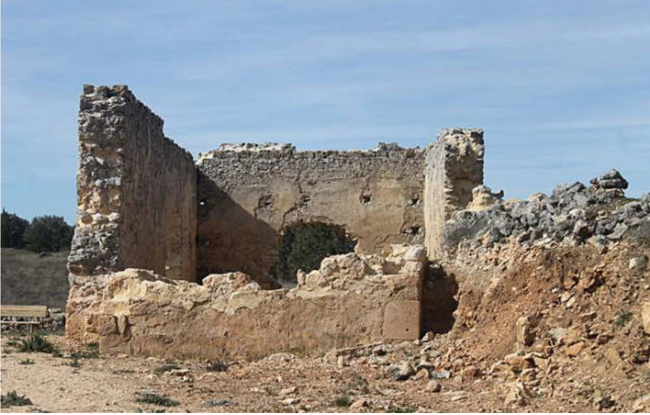
Parque Arqueológico Santa Lucía, Andaluz, 2020.

En los antiguos territorios de la Corona de Castilla, fueron especialmente significativas, los reales y fuertes practicados sobre la moneda de vellón y cobre durante los reinados de Felipe III y Felipe IV. Estos marcos se aplicaban para abarcar su valor nominal y son un reflejo de la actividad monetaria alcanzada en dicha época.