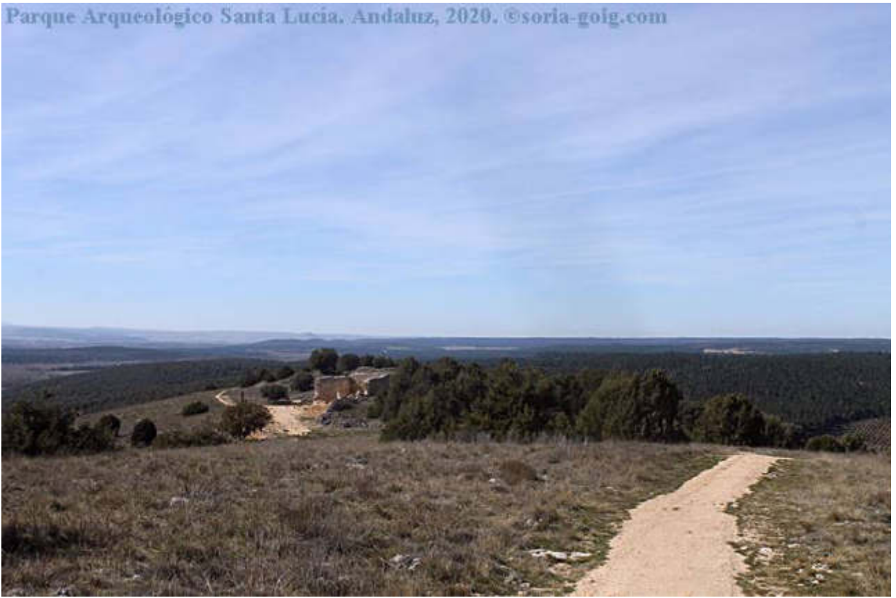
Parque Arqueológico Santa Lucía, Andaluz, 2020.